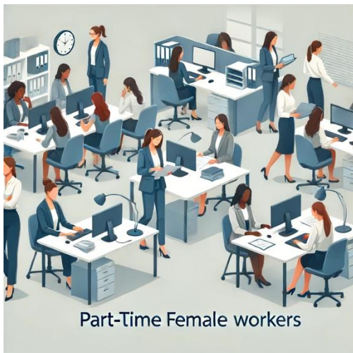
Part-Time Female workers

Enlace: Acceder a Sentencia del TS de 09/05/2024